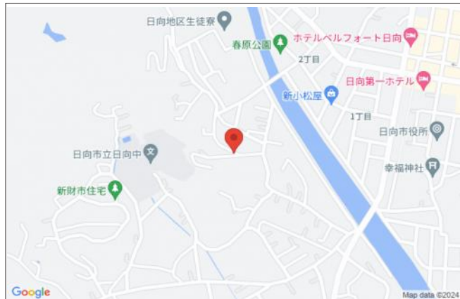
日向中学校すぐそば 整地済み